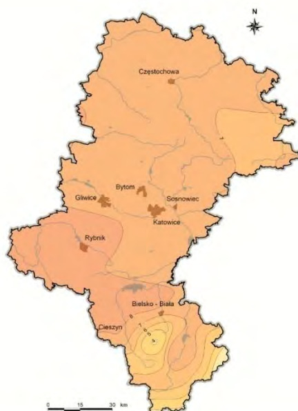
Rysunek. Średnia roczna temperatura (źródło: Przyroda Województwa Śląskiego)

Przy charakterystyce klimatycznej szczególnie istotne są warunki opadowe na analizowanym obszarze, od których zależy ilość wody pozostającej w obiegu. Z uwagi na to, iż w obrębie Pyskowic nie ma żadnego posterunku opadowego IMiGW, dla scharakteryzowania stosunków opadowych zestawiono dane pomiarowe z najbliższego terytorialnie posterunku opadowego w Łubiu Górnym.