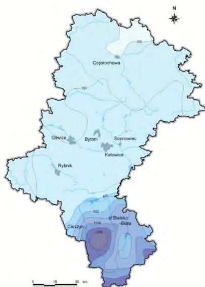
Rysunek. Średnia roczna suma opadów

Średnie roczne sumy opadów atmosferycznych w analizowanym rejonie kształtują się w granicach 762 mm.