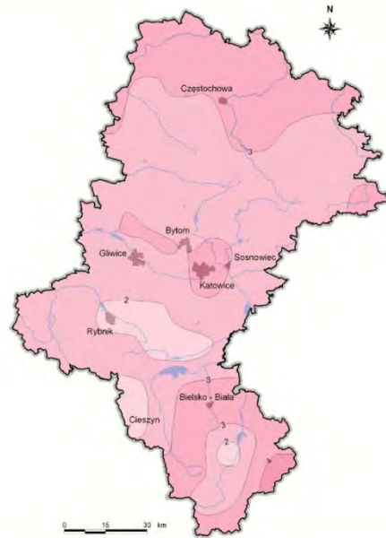
Rysunek. Średnia roczna prędkość wiatru