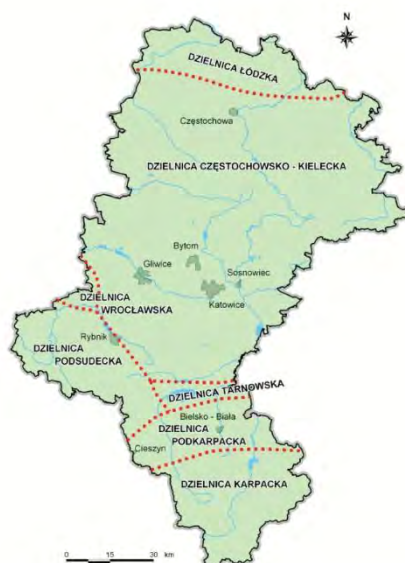
Rysunek. Regionizacja rolniczo – klimatyczna wg R. Gumińskiego zmodyfikowana przez J. Kondrackiego

Uwzględniając rejonizację rolniczo – klimatyczną wg R. Gumińskiego (1948) obszar objęty opracowaniem zlokalizowany jest w środkowej części dzielnicy XV – częstochowsko – kieleckiej.